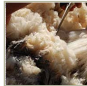
Vellón sin lavar

A pesar de ser un material contemporáneo, evoca al labor artesanal ya que era utilizado hace siglos por el hombre. Con este proyecto se propone revalorizar un material ecológico retomando las costumbres artesanales del hombre e incorporando la industria al proceso de fabricación explorando nuevas variantes de uso tanto en arquitectura como en moda, diseño industrial. etc.