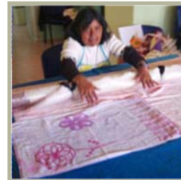
Taller Centro de Día Queniur

MATRA se propone acercar herramientas para mejorar la relación con el medio ambiente, producir nuevas fuentes de recursos económicos y relaciones sociales.