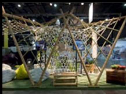
Stand "Mundo Sustentable" Feria Puro Diseño 2010