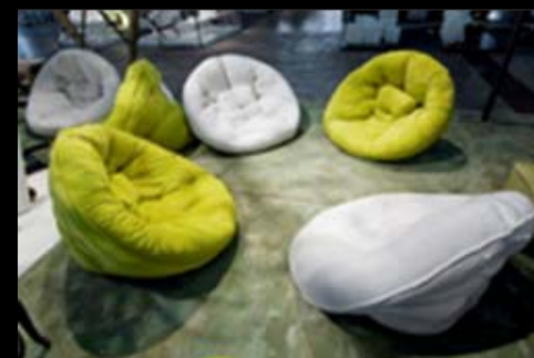
Producto Za Zen - Remade in Argentina