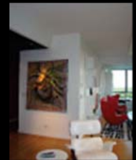
Stand Feria Puro Diseño 2010